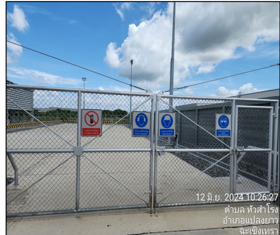
ป้ายเตือนความปลอดภัย