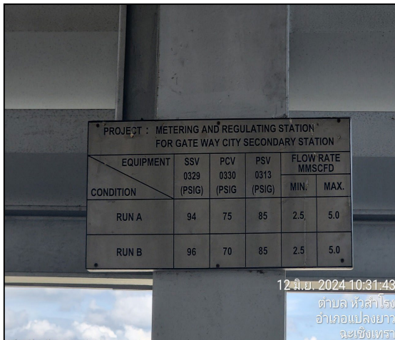
สถานีควบคุมความดันและวัดปริมาณก๊าซ