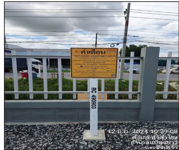
ป้ายเตือนแนวท่อส่งก๊าซธรรมชาติ